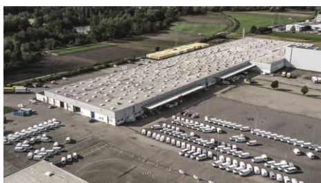
Bildunterschrift 1: Das Montagewerk (E-Factory) der AL-KO Vehicle Technology Group in Günzburg-Deffingen.

Volkswagen Nutzfahrzeuge nutzt für seinen Transporter T6.1 ab sofort auch wieder das AL-KO Chassis. Dank der Umrüstung und der damit verbundenen intelligenten Leichtbautechnologie hat das Fahrzeug nun ein zulässiges Gesamtgewicht von 3.500 kg statt 3.200 kg, also 300 kg mehr Nutzlast zur Verfügung. Für Volkswagen-Transporter mit AL-KO Chassis steht dabei das Elektronische Stabilitätsprogramm (ESP) serienmäßig zur Verfügung. Ebenso sind die unterschiedlichen Radstände und damit die größere Aufbauängenvarianz hervorzuheben. Der Volkswagen T6.1 steht zunächst mit Verbrennerantrieb zur Verfügung.