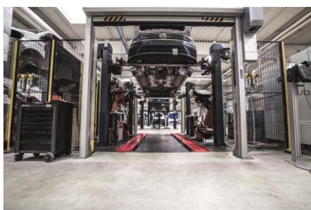
Bildunterschrift 2: Bereits seit 2019 übernimmt die AL-KO Vehicle Technology Group für ABT e-Line die Elektrifizierung verschiedener Nutzfahrzeugmodelle.